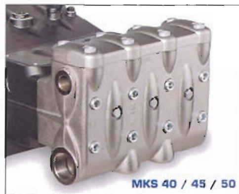
MKS 40 / 45 / 50